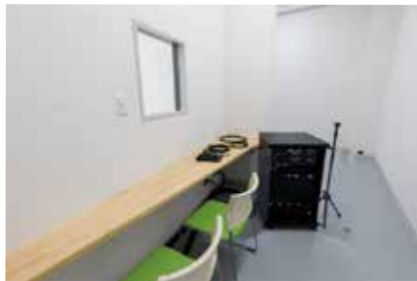
下手 (簡易 PA オペレーション可能)